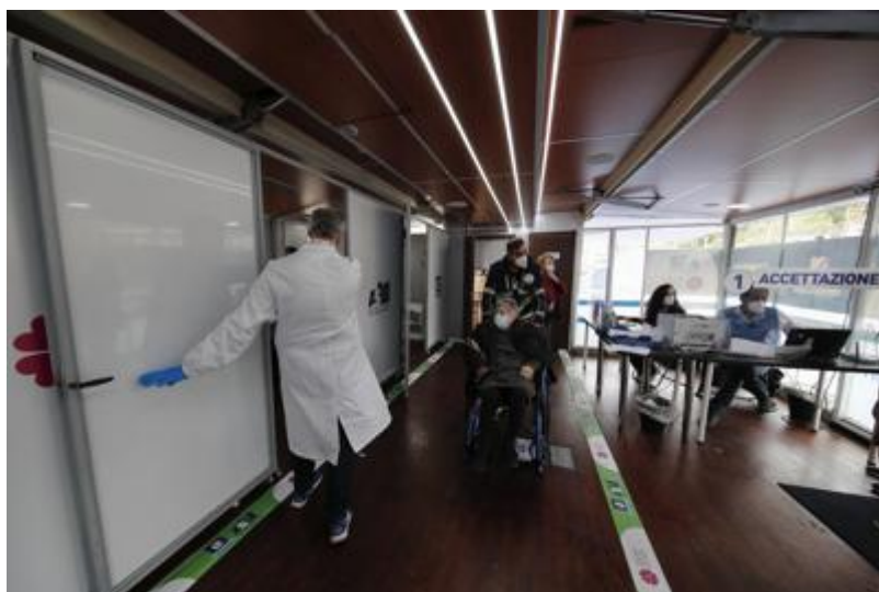
Sanità: Onda, Bollini RosArgento a 205 Rsa e case di cura in Italia