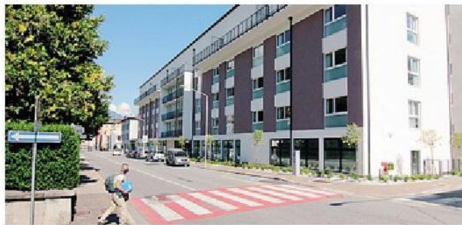
La Residenza Bernina di Sondrio

L'attribuzione dei bollini, avviene sulla base di un questionario strutturato su specifici requisiti considerati fondamentali dall'Advisory Board che tengono conto dell'assistenza clinica e dei servizi offerti, ma non solo; viene infatti ampiamente valutato anche il lato umano dell'assistenza alla persona.