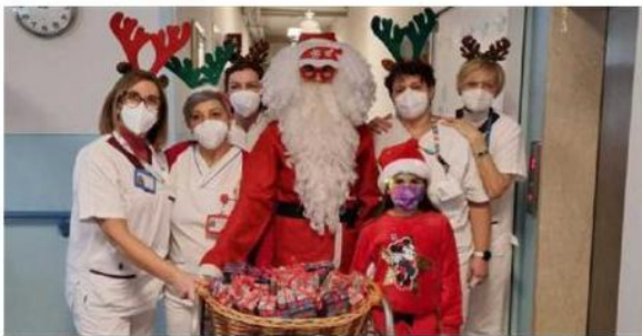
La distribuzione dei doni agli ospiti alla Casa di riposo di Rezzato premiata con i Bollini Rosa e Argento

IRICONOSCIMENTI Bollini RosaArgento anche agli Anni Azzurri