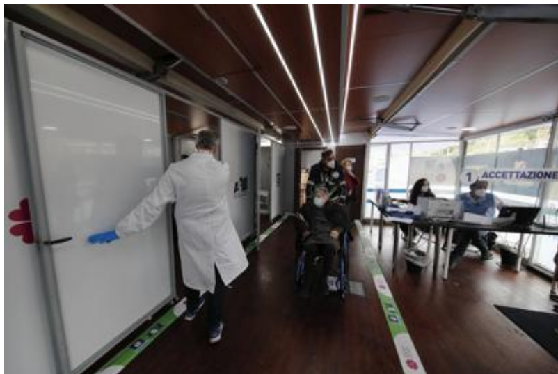
Sanità: Onda, Bollini RosArgento a 205 Rsa e case di cura in Italia