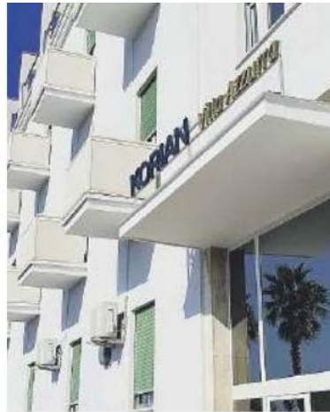
Villa Azzurra Korian di Terracina

Le tre residenze per anziani del Gruppo Korian - leader europeo nei servizi di assistenza e cura - presenti in provincia di Latina sono state premiate da Fondazione Onda, l'Osservatorio nazionale sulla salute della donna e di genere, per il biennio 2023-2024 nell'ambito della quarta edizione dei Bollini RosaArgento. Le strutture Rsa che si sono distinte e sono sta-